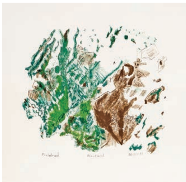
14 | MAX WEILER Absam 1910 – 2001 Wien Waldland Farblithographie handsigniert, bezeichnet und datiert (19)98 Probedruck, 40 x 40 cm