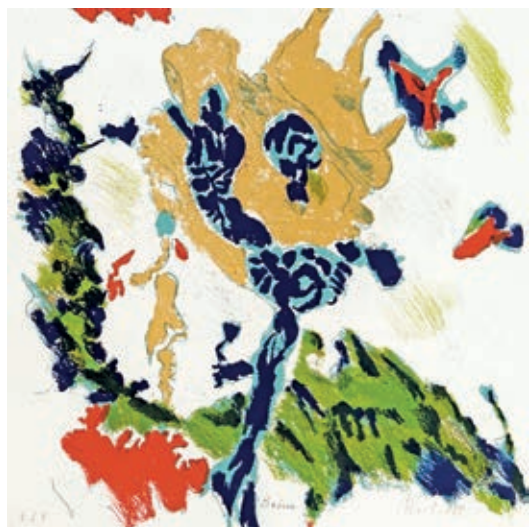
15 | MAX WEILER Absam 1910 – 2001 Wien Baum Farblithographie handsigniert, bezeichnet und datiert (19)89 E.d.K. (Edition des Künstlers), 29 x 29 cm