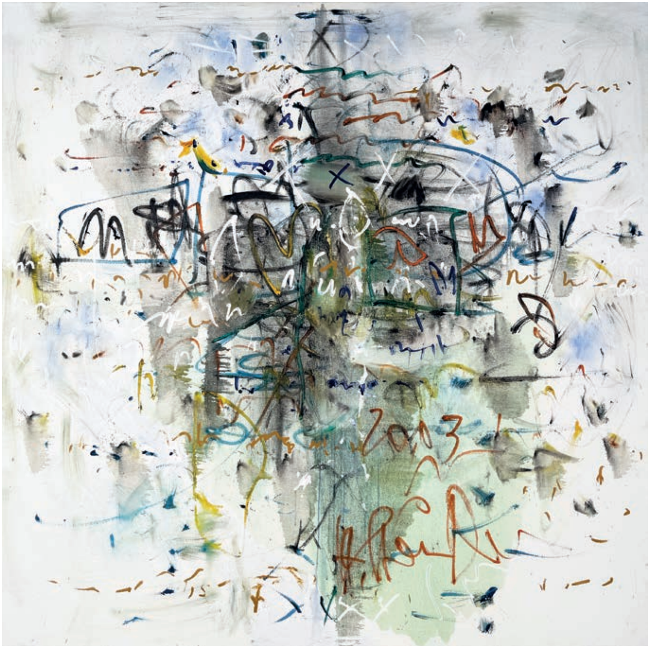
11 | HANS STAUDACHER St. Urban 1923 – 2021 Wien The Heart of Nature Öl auf Leinwand signiert und datiert 2003 150 x 150 cm