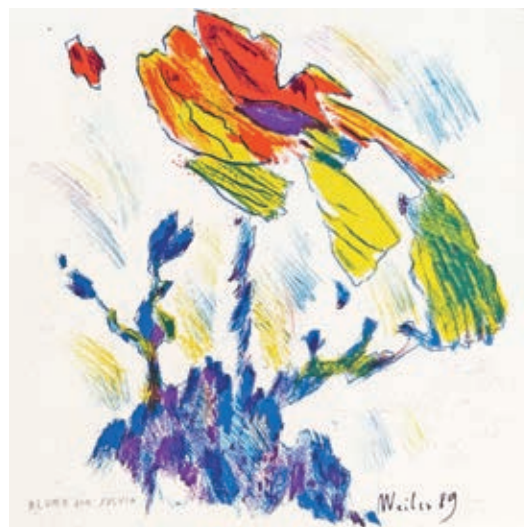
16 | MAX WEILER Absam 1910 – 2001 Wien Blume Farblithographie signiert und datiert (19)89, von Hand bezeichnet 29 x 29 cm